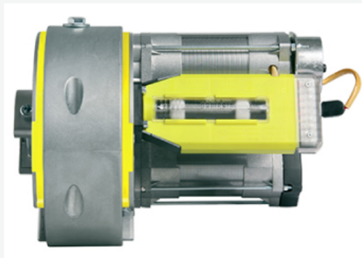
ES 76 - 2M EVOLUTION - cod. 71910000 Motore centrale per serrande serie ES Evolution a 2 motori.

Serie storica dei nostri elettroriduttori, nasce nel 1972 come il primo motore "aperto in due parti", assemblabile anche su serrande già installate senza smontare o modificare l'albero; un primato che valse un brevetto mondiale. Una vera rivoluzione per quel tempo ma sempre attuale grazie ai continui affinamenti tecnologici per essere sempre al passo con i tempi. I motori della serie EVOLUTION sono realizzati con soluzioni tecniche e materiali all'avanguardia, che garantiscono affidabilità e durata nel tempo.