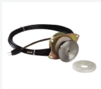
Blocco elettromagnetico Cavo 6 mt. cod. 75120000