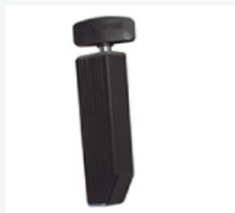
Sblocco interno. cod. 75160000